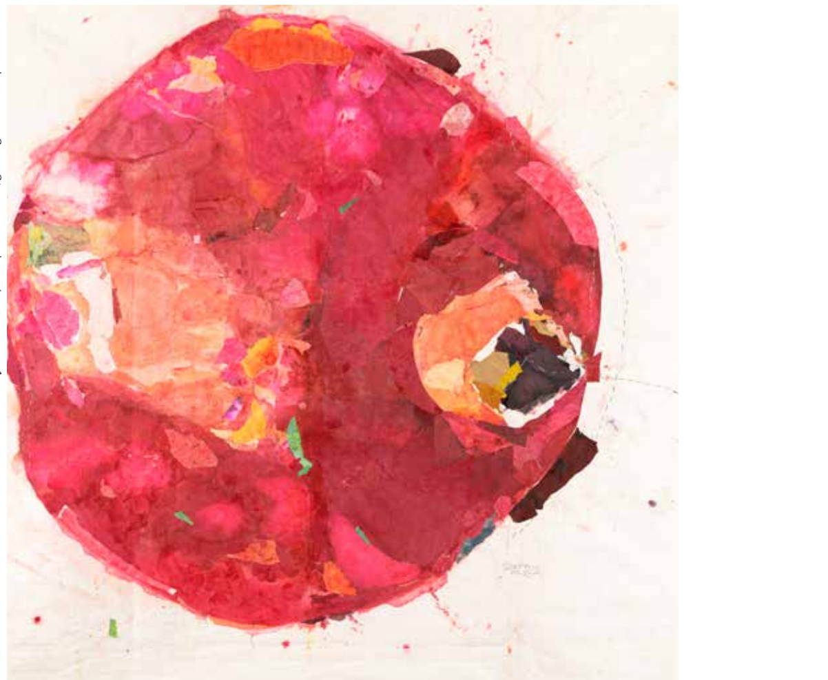
Beyond limitations, 2021 | mixed media/gemengde techniek | 124 x 124 cm