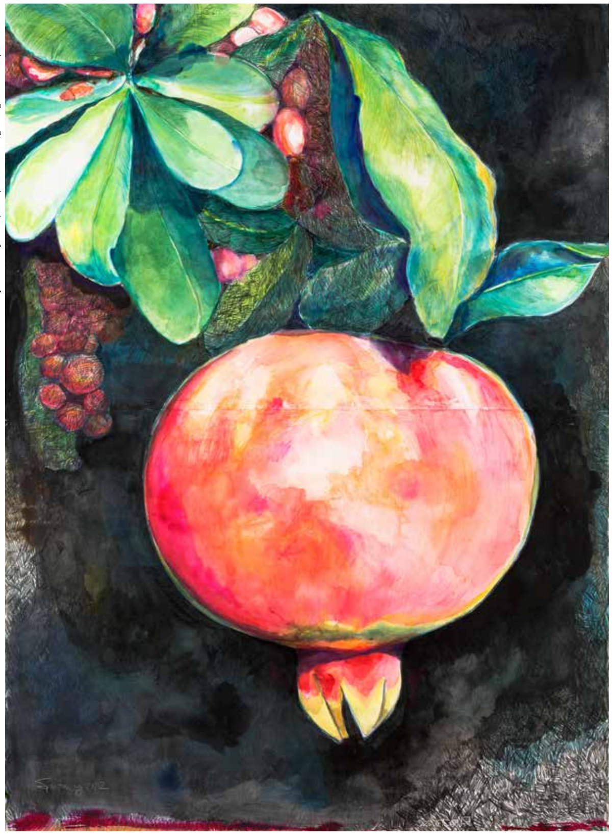
The omnipresence of silence, 2021 | mixed media/gemengde techniek | 136 x 100 cm