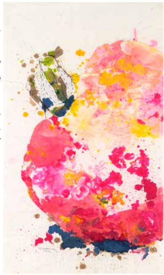
Second before, 2021 | mixed media/gemengde techniek | 115 x 69 cm