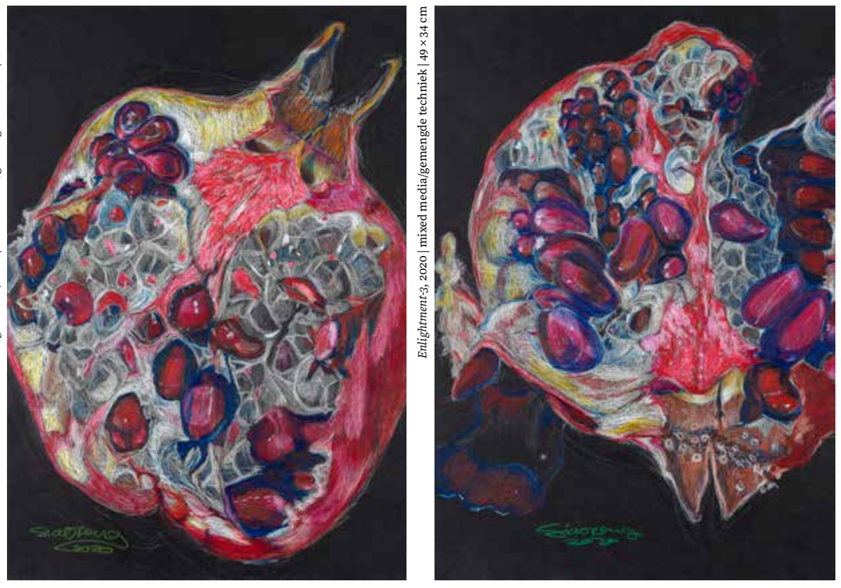
Enlightenment, 2020 | mixed media/gemengde techniek | 49 x 34 cm

Study | Studie • Academy Charles Montaigne for Fashion and Design (1987-1992). • Pigment Inker, sheilac ink, chalk, collage, thread sometimes sewn into the drawing. • Mode Academie Charles Montaigne (1987-1992), specialiste in tekstielontwerpen. Mixed media | Gemengde techniek • Large drawings on watercolor- and Chinese rice paper. • Grote tekeningen op aquarel- en Chinees rijstpapier. Parents | ouders • Born in Amsterdam. Bicultural artist. • Geboren te Amsterdam. Kunstenaar van biculturel afkomst. Woont en werkt in Amsterdam. Enlightenment, 2020 | mixed media/gemengde techniek | 49 x 34 cm