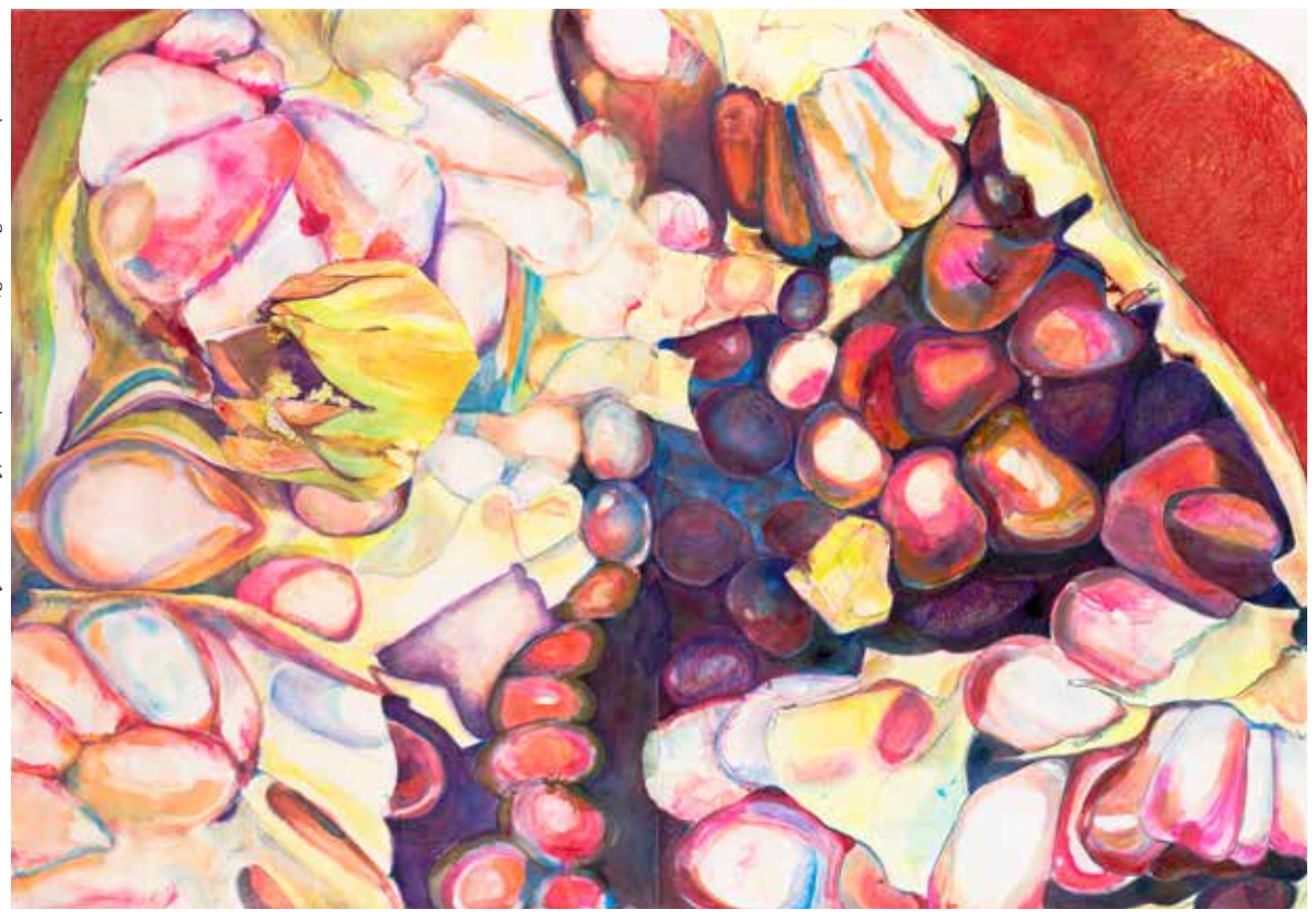
Beauty with a history, 2021 | mixed media/gemengde techniek | 104 x 150 cm